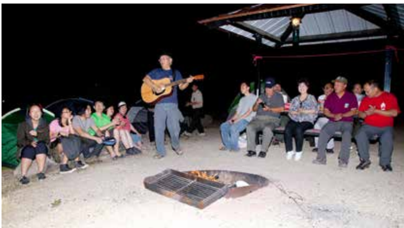
Hát với nhau bên bờ Snack River, Idaho

Trời tối hẳn, vạn vật như lắng đọng trong cõi âm u của núi rừng. Một ngọn lửa được bốc lên, lên nữa, bốc cao cho bùng cho sáng...tất cả mọi người hòa theo những cánh tay đơ cao, mắt long lanh, dồn sinh lực người và sinh khí của