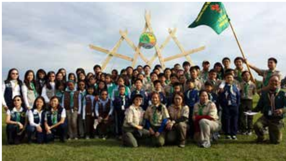
Liên Đoàn Đất Việt

niên của Hướng Đạo Việt Nam miền Trung Hoa Kỳ lấy theo tên nguyên thủy của Trại Hợp Bạn Quốc Gia là Trại Giữ Vững tại Suối Tiên, Biên Hoà, tháng 12 năm 1970. Khởi đi với trại Giữ Vững đầu tiên của HĐVN miền Trung Hoa Kỳ vào cuối tuần áp Lễ Tạ Ôn năm 1997 ở Lake of Houston và liên tục 17 năm đến nay, năm 2013 là Trại Giữ Vững XVII vừa được thực hiện vào cuối tuần 8-9-10 tháng 11 -2013 tại đất Trại Gordon Ranch ở Richmond một thành phố phụ cận Houston chỉ cách khu thương mại Bellaire của người Việt khoảng 30 phút lái xe.