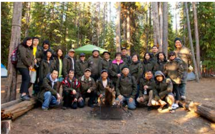
Tại đất trại Grand Village .

Yellowstone là một công viên quốc gia của Hoa Kỳ nằm ở phía Tây trên ba tiểu bang Wyoming, Montana và Idaho. Ngày 1 tháng 3 năm 1872 Tổng thống Hoa Kỳ Ulysses S. Grant đã ký công nhận địa danh Yellowstone thuộc tiểu bang Wyoming - nằm trên rặng núi Rocky Mountain thuộc trung tây Hoa Kỳ - vào hàng Công viên của Quốc gia sau khi đã được Quốc hội biểu quyết. Đây là một công viên lớn nhất của Hoa Kỳ và cũng là lớn nhất thế giới với một diện tích 3,468.4 Square Miles hay 8,983 km 2 , rộng hơn diện tích 2 tiểu bang Rhode Island và Delaware cộng lại. Công viên nằm trên 3 tiểu bang: 95% thuộc bang Wyoming, 3% thuộc bang Montana và 1% nằm trên bang Idaho, kéo dài từ Bắc xuống Nam khoảng 63 miles (101 km) và từ Tây sang Đông dài 54 miles (87 km).