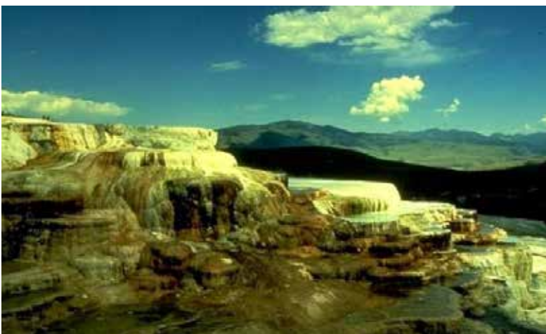
Đá Vàng, Mammoth Hot Spring