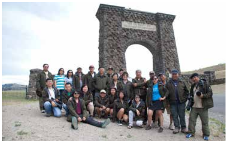
Tại cổng chính Công viên Quốc Gia Yellowstone (North Entrance)