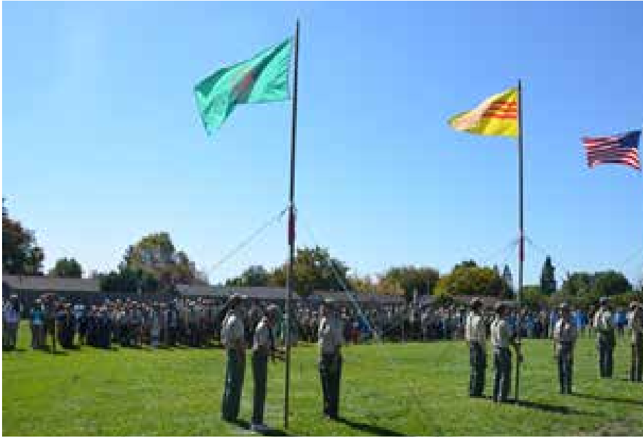
Lễ chào cờ và khai mạc Ngày HDVN 2013