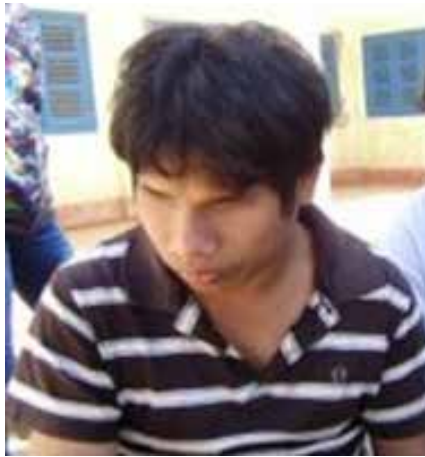
Chú Sâm mù lòa, đi làm nuôi cha bệnh cùi