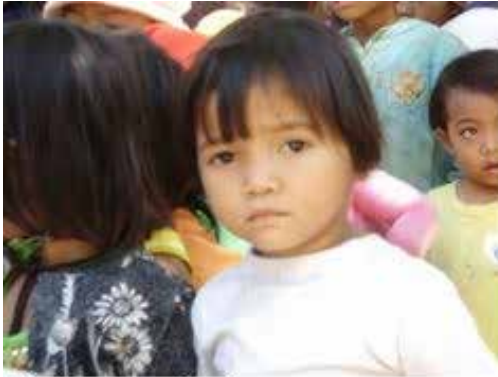
Khuôn mặt ngây thơ