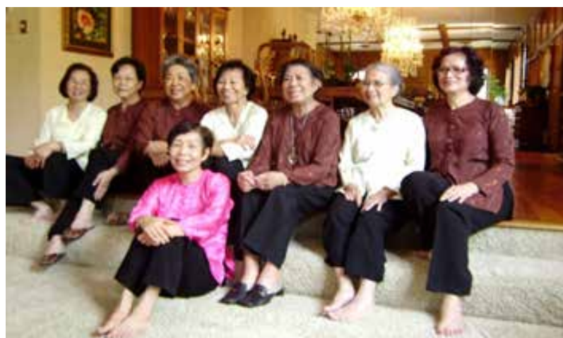
Chủ nhật 18 Aug. 2013, các chị họp làng với áo bà ba.